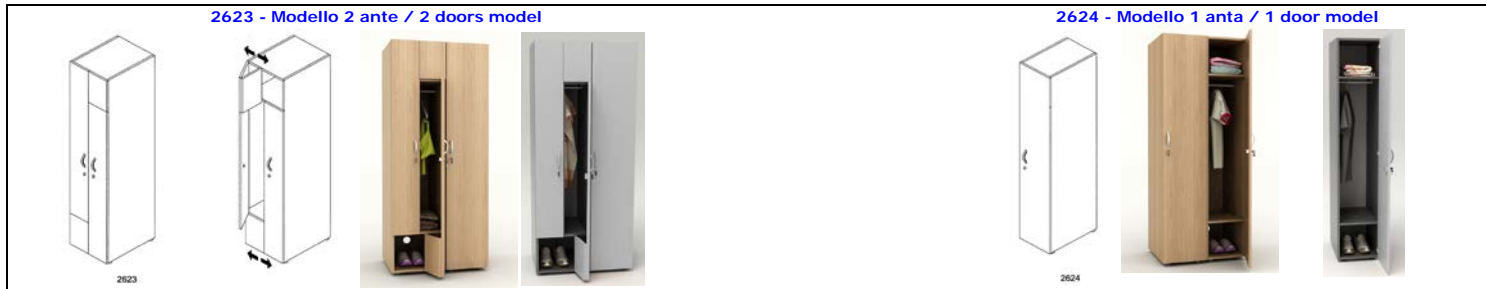
2624 - Modello 1 anta / 1 door model